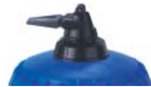
Встроенный байпас: Система запуска (on) и остановки (off) всасывания продукта.

Предлагаемые опции позволяют лучше адаптировать дозатор к вашим needs. Обоснованность их применения определяется с помощью наших технических отделов.